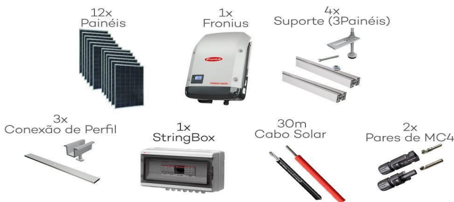
Figura 3 – Kit de instalação fotovoltaico ON GRID .

A Figura 3 apresenta um modelo de kit de instalação fotovoltaico ON GRID .