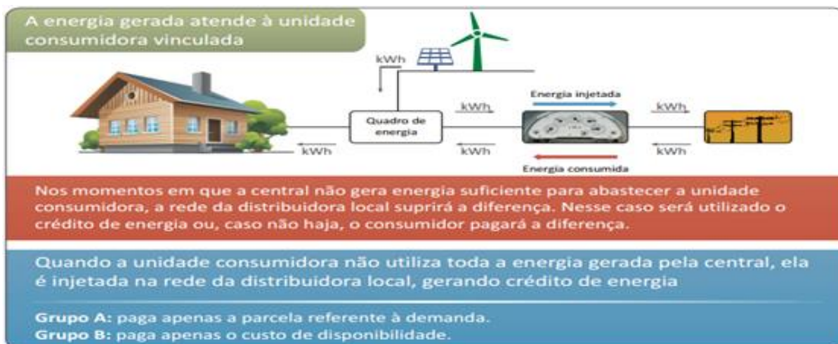
Figura 2 - sistema de Energia Solar Fotovoltaica.

A Figura 2 demonstra como é o sistema de energia solar fotovoltaica.